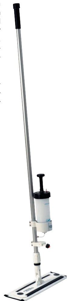
Floor-Master exkl. Mophalter (separat bestellen) 11825101