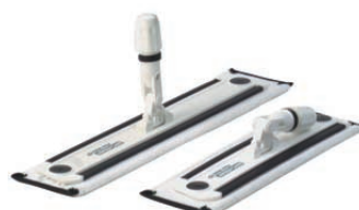
Mophalter 40/50 cm 11825111/2