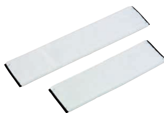
Microfaser-Mops 40/50 cm 11825116/7